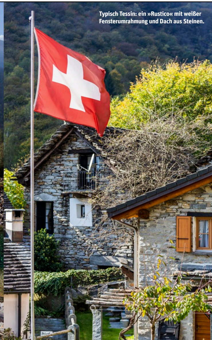
Typisch Tessin: ein »Rustico« mit weißer Fensterumrahmung und Dach aus Steinen.