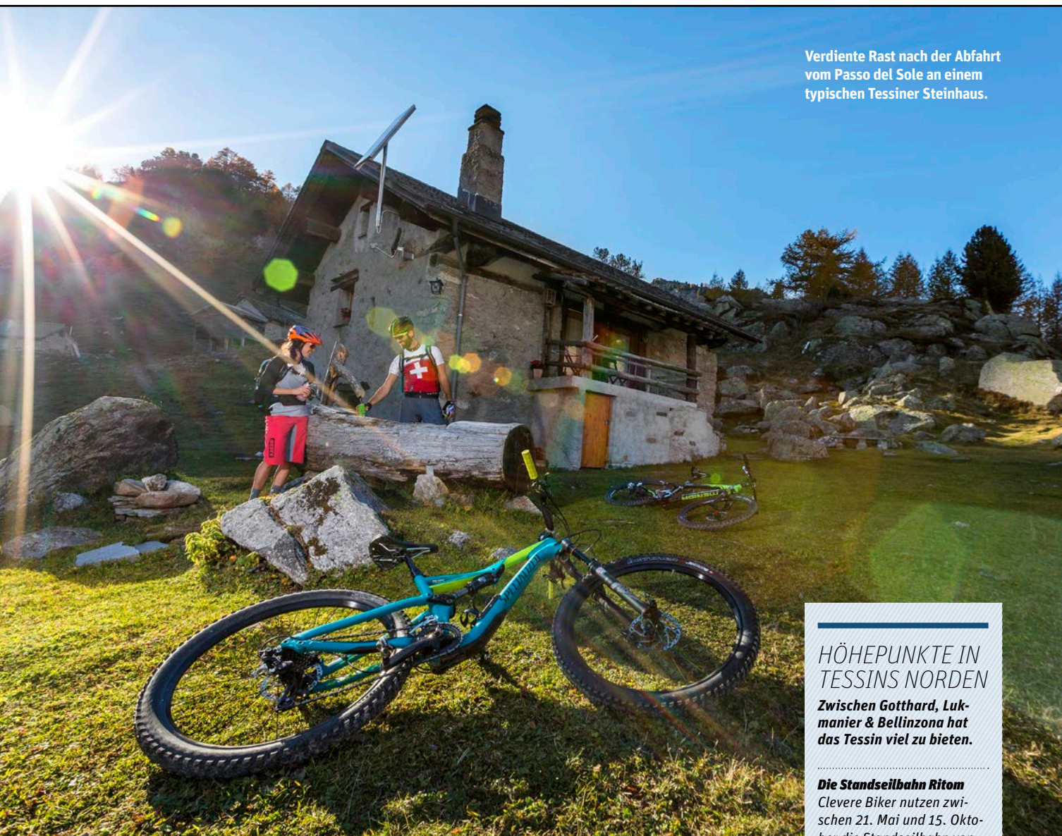
Verdiente Rast nach der Abfahrt vom Passo del Sole an einem typischen Tessiner Steinhaus.